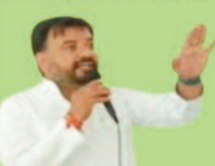
चौहान नीत पवार राष्ट्रीय अध्यक्ष