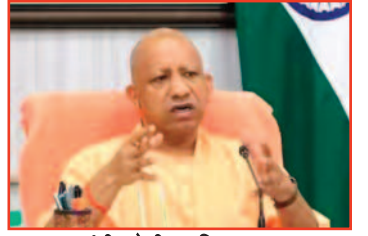
मुख्यमंत्री योगी आदित्यनाथ

यूपी में रेल हादसों पर एक्शन में सीएम योगी, अब आरोपियों की खैर नहीं