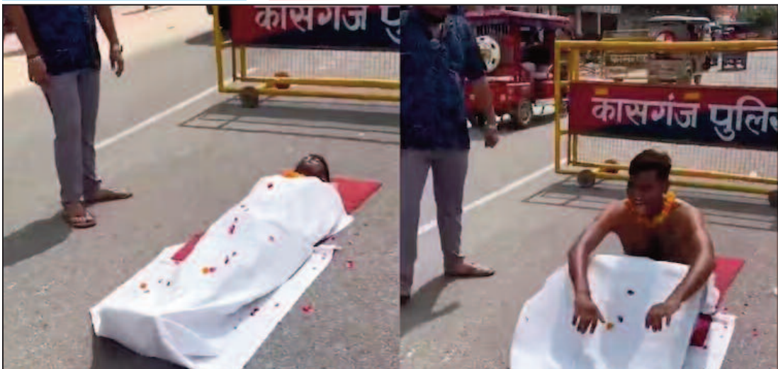
यूपी की कासगंज से हेरान करने वाला मामला सामने आया, जहां इंट्रोग्राम पर मशहूर होने के लिए एक युवक ने बीच सड़क में मौत का नाटक किया.

सोशल मीडिया पर रील बनाने का नशा युवाओं के सिर पर इतना चढ़कर बोल रहा है कि वो कुछ भी करने से परहेज नहीं कर रहे हैं. कुछ लाइक्स और फॉलोवर्स बढ़ाने के लिए कभी ये अपनी जान को खतरे में डाल देते हैं तो कभी दूसरे के लिए परेशानी बढ़ा देते हैं.