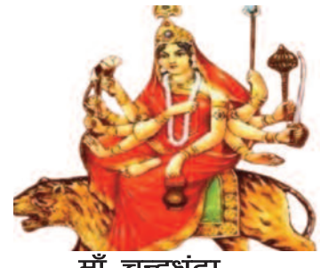
मौ चन्द्रधंटा तीसरा नवरात्री

बर्ष :12 अंक :278 पृष्ठ -4 दिनांक 05 अक्टूबर 2024 दिन शुनिवार