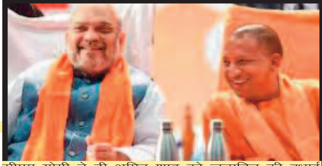
सीएम योगी ने दी अमित शाह को जन्मदिन की बधाई

केंद्रीय गृहमंत्री अमित शाह का आज अपना 60वां जन्मदिन मना रहे हैं। इस अवसर पर उत्तर प्रदेश के मुख्यमंत्री योगी आदित्यनाथ ने उन्हें जन्मदिन की बधाई दी है, सीएम योगी ने उनकी लंबी उम्र की कामना की और उन्होंने पार्टी के करोड़ों कार्यकर्ताओं का प्रेरणा स्रोत बताया। उन्होंने कहा कि अमित शाह ने अपने प्रतिबद्धता से देश के मान सम्मान को बढ़ाया है। सीएम योगी आदित्यनाथ ने अपने आधिकारिक सोशल मीडिया हैंडल एक्स पर गृहमंत्री अमित शाह की तस्वीर शेयर करते हुए लिखा-अनुशासन और कर्मठता के जीवंत प्रतीक, करोड़ों कार्यकर्ताओं के प्रेरणास्रोत, सहकार से समृद्धि के भाव को निरंतर चरितार्थ कर रहे लोकप्रिय जननेता माननीय केंद्रीय