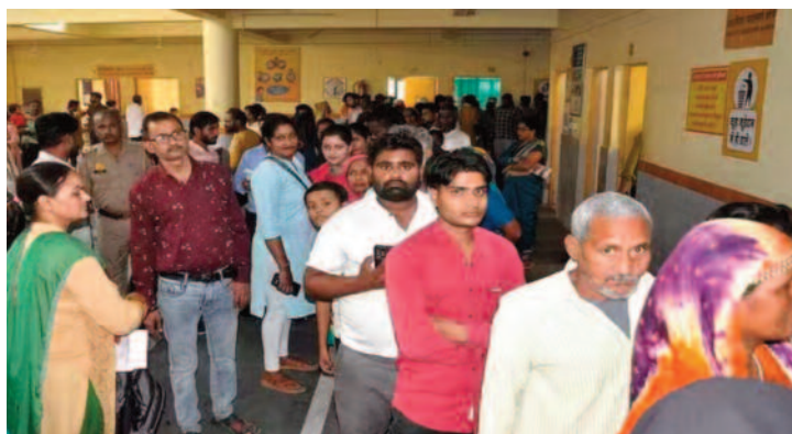
भुकरावली में एक साल का मासूम और एलमपुर में 12 साल का बालक डेंगू से पीड़ित मिला है। इसके अलावा खैर के मिलक में 50 साल की महिला और अत. रौली के बुलनगरिया में 24 साल की महिला डेंगू से पीड़ित मिली हैं। इन सभी का उपचार घरों पर चल रहा है। स्वास्थ्य विभाग की टीम ने इनके घरों के आसपास फॉगिंग कराकर कीटनाशक का छिड़काव कराया है। इसके अलावा अक. राबाद क्षेत्र की ग्राम पंचायत नगलाबरी में

नौरंगाबाद क्षेत्र के कुंवरनगर में एक किशोरी समेत दो डेंगू के मरीजों की पुष्टि हुई है। ग्रामीण इलाके में लोधा के भुकरावली में एक साल का मासूम और एलमपुर में 12 साल का बालक डेंगू से पीड़ित मिला है। इसके अलावा खैर के मिलक में 50 साल की महिला और अत. रौली के बुलनगरिया में 24 साल की महिला डेंगू से पीड़ित मिली हैं। अलीगढ़ जिले में डेंगू के मरीजों की संख्या लगातार बढ़ती जा रही है। 23 अक्टूबर को जनपद में एक मासूम समेत डेंगू के छह नए मरीज मिले हैं। इसके साथ ही जिले में डेंगू पीड़ितों की संख्या 84 पहुंच गई है। इधर, विजयगढ़ में एक युवक की मौत भी हुई है। हालांकि, स्वास्थ्य विभाग का कहना है कि युवक की मौत बुखार से हुई है। 23 अक्टूबर को शहर के नौरंगाबाद क्षेत्र के कुंवरनगर में एक किशोरी समेत दो डेंगू के मरीजों की पुष्टि हुई है। ग्रामीण इलाके में लोधा के