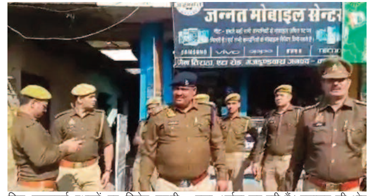
कासगंज में होली के त्योहार को शांतिपूर्वक मनाने के लिए प्रशासन ने व्यापक सुरक्षा व्यवस्था की है। जिले को 5 जोन और 23 सेक्टर में बांटा गया है। कुल 1460 स्थानों पर होलिका दहन किया जाएगा। इनमें से 94 होलिका दहन स्थल मिश्रित आबादी वाले संवेदनशील क्षेत्रों में हैं। होली के दौरान 44 स्थानों को हॉट स्पॉट के रूप में चिह्नित किया गया है। सभी संवेदनशील स्थानों पर पुलिस बल तैनात किया गया है। यातायात व्यवस्था के लिए विशेष ड्यूटी सुरक्षा व्यवस्था को मजबूत बनाने के लिए जयल 112 पुलिस और पर्याप्त संख्या क्यूआरटी मोबाइल तैनात की गई हैं। यातायात व्यवस्था को सुचारु रखने के