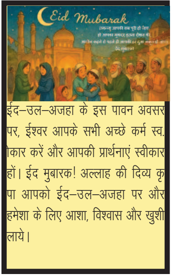
ईद-उल-अजहा के इस पावन अवसर पर, ईश्वर आपके सभी अच्छे कर्म स्व. आकार करें और आपकी प्रार्थनाएं स्वीकार हों। ईद मुबारक! अल्लाह की दिव्य कृपा आपको ईद-उल-अजहा पर और हमेशा के लिए आशा, विश्वास और खुशी लाये।

माँ दुर्गा के ब्रह्मचारिणी रूप की पूजा की जाती है, जो तपस्या और वैराग्य की देवी मानी जाती हैं. इस दिन, भक्त माँ ब्रह्मचारिणी की पूजा करते हैं, जो कठोर तपस्या के माध्यम से भगवान शिव को पति के रूप में प्राप्त करने के लिए जानी जाती हैं। माँ ब्रह्मचारिणी की पूजा का महत्त्व तपस्या और वैराग्य की देवी माँ ब्रह्मचारिणी को तपस्या और वैराग्य की देवी माना जाता है।