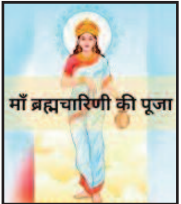
माँ ब्रह्मचारिणी की पूजा

माँ दुर्गा के ब्रह्मचारिणी रूप की पूजा की जाती है, जो तपस्या और वैराग्य की देवी मानी जाती हैं. इस दिन, भक्त माँ ब्रह्मचारिणी की पूजा करते हैं, जो कठोर तपस्या के माध्यम से भगवान शिव को पति के रूप में प्राप्त करने के लिए जानी जाती हैं। माँ ब्रह्मचारिणी की पूजा का महत्त्व तपस्या और वैराग्य की देवी माँ ब्रह्मचारिणी को तपस्या और वैराग्य की देवी माना जाता है।